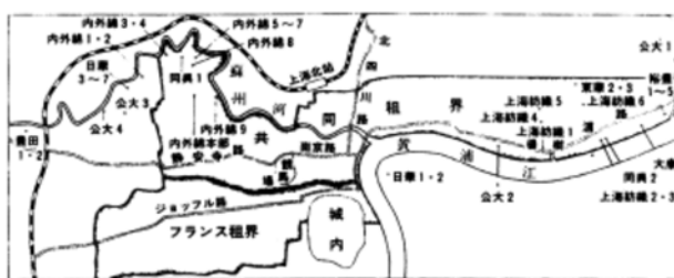
出处: 《「國際都市」上海のなかの日本人》, 第73页。

町内会被划分为“中部”“北部”“东部”(杨树浦)及“南部”(旧英租界及法租界)四个大的区域, 36 年版的记载将各会所属详细区划 1-14