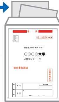
出願書類提出用封筒宛名表