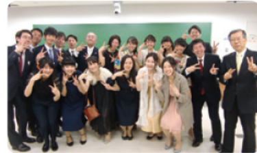
国際公共政策学科2組