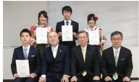
青雲キャリアチャレンジ賞受賞者の皆さんと

青雲キャリア支援基金活用事業として、2017年度から、「青雲キャリアチャレンジ賞」を設けています。これは、在学中に課外で取り組み、キャリア形成に向けて優れた成果を挙げた法学部生を表彰し、副賞を授与して、その成果を称えとともに、在学中のキャリア形成活動を促進することを狙ったものです。青雲キャリアチャレンジ賞が、今後、優れたキャリア形成活動の励みになるものとして広く認知されるよう、努めて参ります。