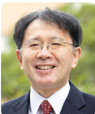
大阪大学大学院法学研究科長 大阪大学法学部長