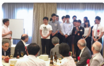
現役学生の皆さん