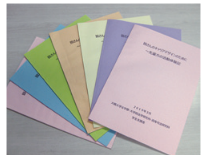
『皆さんのキャリアデザインのために～先輩方の活動体験記』

学生支援室は、学生のキャリア形成支援、修学環境の整備を目的とした組織として、様々な事業に取り組んでいますが、キャリアデザイン・データベースの構築は主要な事業のひとつです。今年も『皆さんのキャリアデザインのために～先輩方の活動体験記』を刊行しています。この小冊子には、就職活動・進学準備等の体験記と後輩へのメッセージを綴ったレポートの一部が収録されています。他のレポートや昨年度までのレポートは、学内のウェブサイトですべて閲覧できるようになっています。この小冊子の印刷費用とレポート作成者に対する謝礼(1000円の図書カード)は、2016年度より青雲キャリア支援基金によって支えられています。