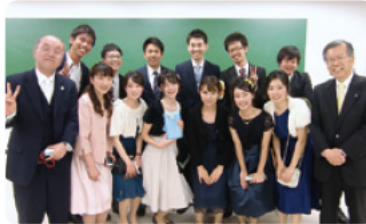
国際公共政策学科1組