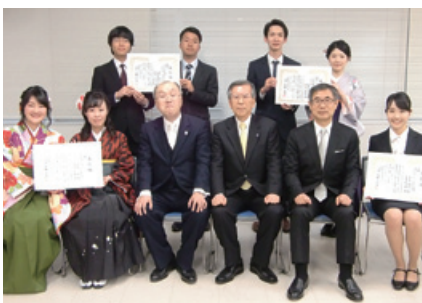
平成30年度 青雲懸賞論文 受賞者の皆さん

平成30年度の青雲懸賞論文は、多数の応募の中から以下の4本が優秀論文として選ばれました。優秀論文は3月25日の法学部卒業式において表彰されました。