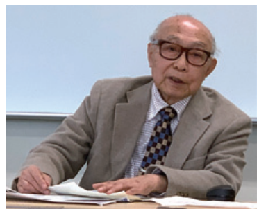
今、出版に向けて準備が進む800頁を超える著作について語る声に熱がこもる山中先生