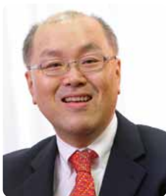
大阪大学大学院法学研究科長 大阪大学法学部長