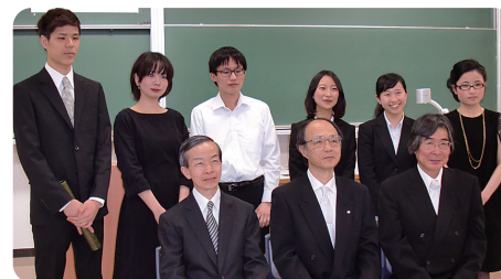
懸賞論文 受賞者の皆さん