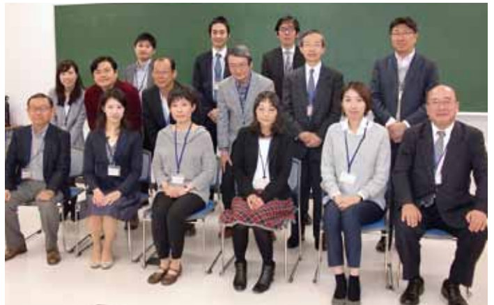
当日参加頂いた法学部卒業生の皆様