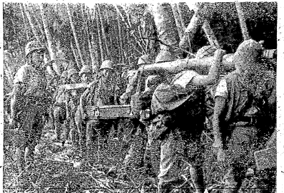
گروهی از مردم در یک جلسه محلی

برای موفقیت در فضای دیجیتال، روزنامه‌ها نیاز به سرمایه‌گذاری در تکنولوژی و جذب نیروهای متخصص دارند. همچنین، تمرکز بر تولید محتوای باکیفیت و جذاب می‌تواند به جذب مخاطب بیشتر منجر شود. آینده روزنامه‌ها بستگی به توانایی آنها در تطبیق با تغییرات دنیای مدرن دارد.