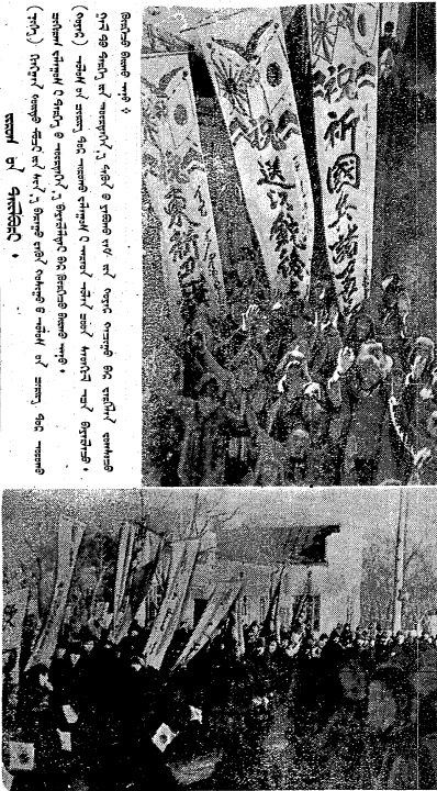
新國黨黨員大會合影