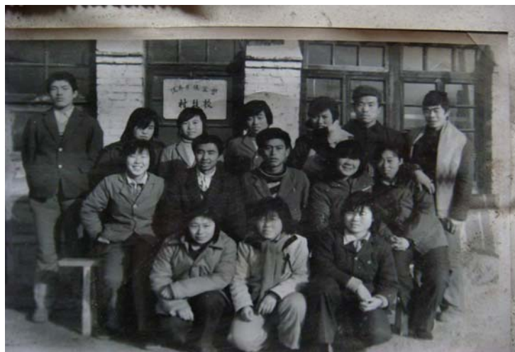
図2 1982年侯家営村村営技術学校の学生の集合写真

総じて言えば、1949年以降、農村の文化教育は大きく発展し、効果は著しく、侯家営村は1987年に非識字者一掃を実現した。もし正規教育と業余文化教育の発展がなければ、この結果は想像できないも